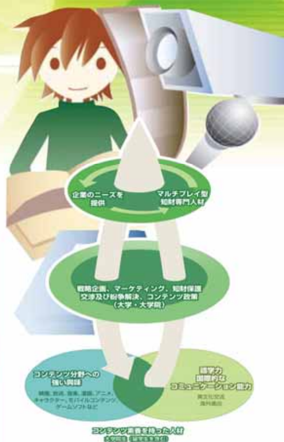
図1 マルチプレイ型知的財産専門人材構想図

文部科学省が平成17年度に開始した、これまでにない新たなコンセプトによるインターンシップ制度の開発を、大学に委託するプログラムです。科学技術人材育成の大きな課題として、自らの専門分野の位置付けを社会的活動全体の中で理解し、現実的課題の中から主体的に問題設定を行い、それに取り組む能力のある「高度専門人材」の育成が急務であるとの認識が、大学及び産業界の双方で高まっています。これらの要求に応えるため、現在までの主として就業体験や職業意識の形成を目的としたインターンシップとは厳密に、産学が人材の育成・活用に関して建設的に協力しあう体制を構築することにより、社会の抱える諸問題や産業界の取り組みを理解し、知識基盤社会を多様に支える、高度で知的な素養のある人材を育成することが目的となっています。