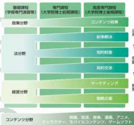
図2 マルチプレイ型コンテンツ知財専門人材育成 カリキュラムイメージ